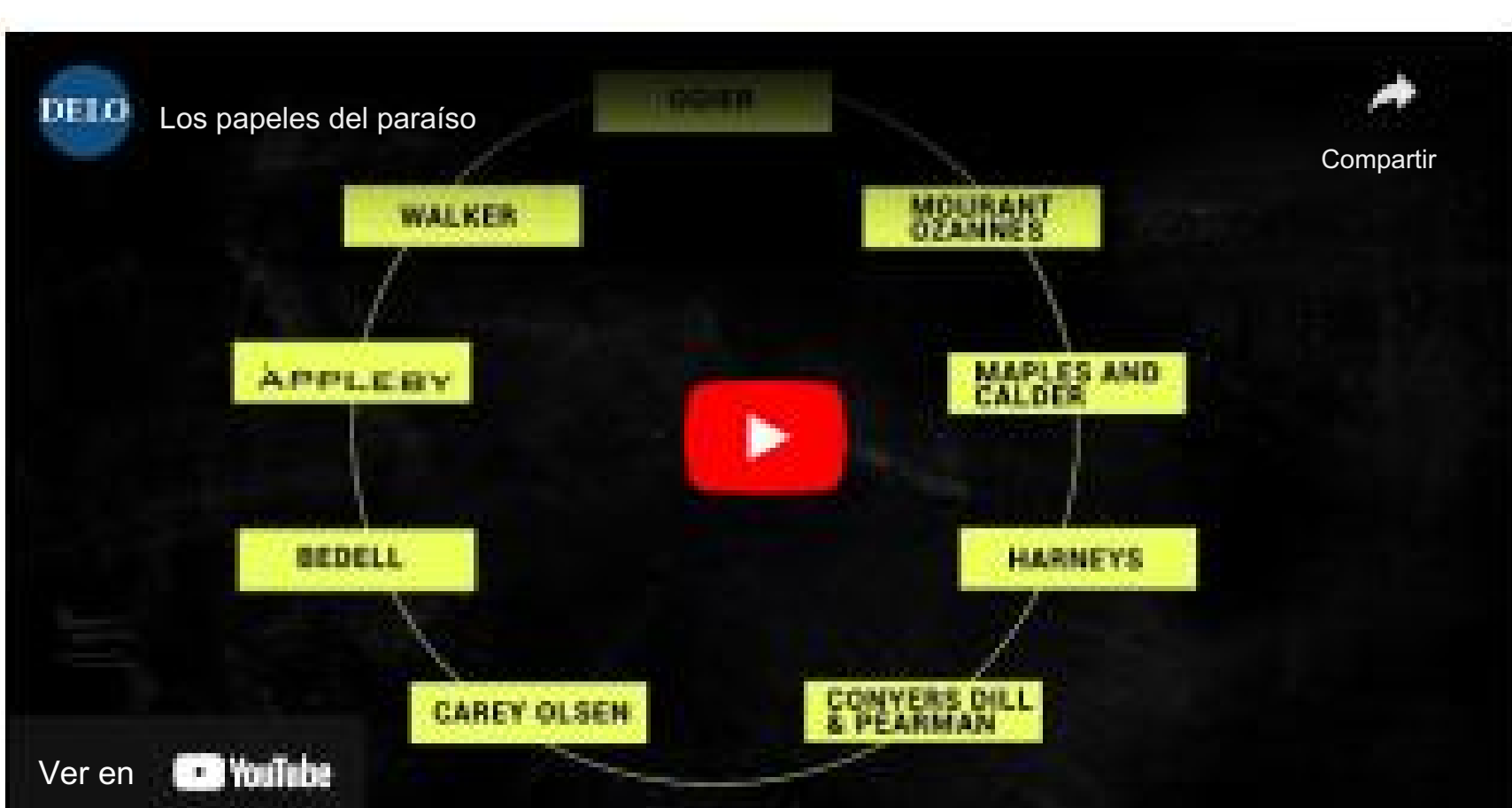
desvío de dinero