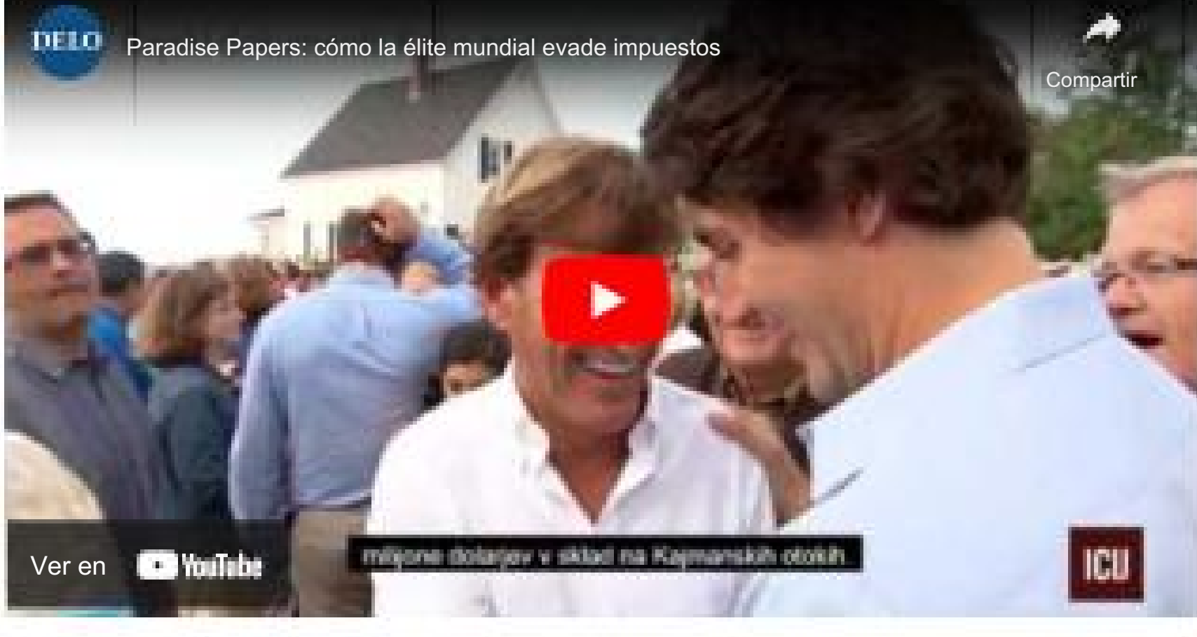
¿Cómo se hacen negocios de todos modos?

Cuando Dela preguntó al respecto, Lyonesse respondió que estaban convencidos de que se trataba de una aplicación cuestionable de la ley sobre competencia desleal. Explicaron que se sometieron a una extensa reestructuración interna en 2012 para definir más claramente las líneas entre la comunidad de compras y el mercadeo en red. Ambos operan de forma transparente y conforme a la ley, afirman. Los casos que todavía están abiertos en Austria se refieren a las condiciones de cooperación, que fueron abolidas en 2014.